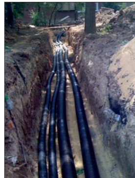
Abb. 2: Verlegung im Sandbett

Laden Sie die Ringbunde dort ab, wo der Abrollvorgang beginnen soll. Fixieren Sie das freie Rohrende am Boden (z. B. mittels Sandsack) und rollen Sie das Rohr neben dem Graben ab. Bei den Mantelrohrdimensionen 90-125 mm empfehlen wir, die Kupplungsmontage neben dem Graben