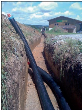
Abb. 1: Rohrgraben